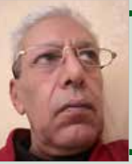
بقلم .... سعيد هادف

ثمة «أشياء» مغاربية تتحلل وتزاح، تتحرك أفقيا وعموديا، بشكل ملموس وبشكل خفي. البلدان المغاربية برمتها تعيش حالة تغيير سياسي بشكل صريح وبشكل ضمني. في تونس، كيف سيكون أداء حكومة لمشيخي؟ وماذا سيترتب عن الحراك البرلماني ضد زعيم النهضة راشد الغنوشي؟ وما هي التطورات التي ستحدث بعد استقالة السراج، والحوار الليبي الليبي؟ وهل ستتصر موريتانيا على الفساد مع حكومة محمد ولد بلال؟ تلك أسئلة من ضمن أخرى، يعيشها الراهن المغاربي، سياسيا وأمنيا واقتصاديا ونفسيا... كل شيء يتحرك ببطء وبحذر. على مستوى المغرب يعيش الرأي العمومي والطبقة السياسية حالة ترقب إزاء ما تبقى من عمر حكومة العدالة والتنمية. أما الجزائر تعيش جدلا حول الدستور الذي فصلنا عن موعد الاستفتاء عليه شهر واحد. البعض يدعو إلى المقاطعة، وبعض آخر يدعو إلى التصويت بنعم، وآخر يدعو إلى التصويت بلا. فكيف ستكون الجزائر ما بعد الاستفتاء على الدستور؟ وكيف تكون المنطقة المغاربية في خضم هذا التفاعل، وبعد حالة المخاض التي تنبسط حينا وتشتد حينا آخر؟